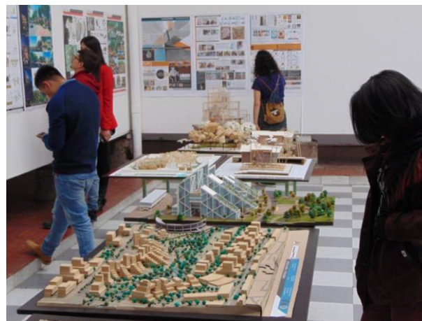
Figura 55. Fotografía Exposición Premios y Menciones AULA.