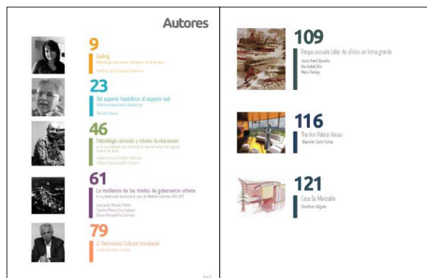
Figura 50. Páginas Interiores de Autores y Artículos Revista Aula No. 3