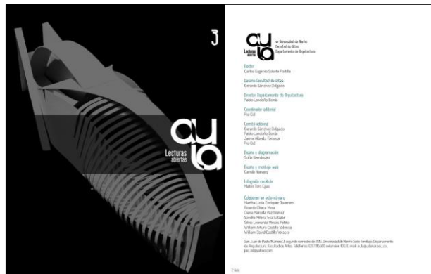
Figura 49. Portada y Suportada Revista AULA No. 3

Hasta el momento se cuenta con tres publicaciones de Revistas AULA, la No. 1: Versiones Impresa y Digital (Ver Figura 49), la No. 2: Versión Impresa (Ver Figura 50) y la No. 3 Versión Digital con Portal Web. 46 (Ver Figura 51).