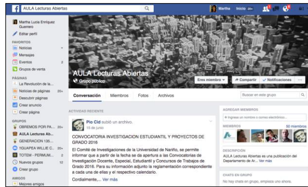
Figura 51. Aula en FACEBOOK.