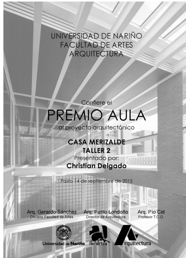
Figura 54. Diploma Premio AULA.